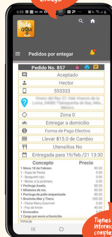
Descripción de pedidos